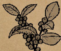
ウメモドキ モチノキ科 モチノキ属

花が梅に似ていることからウメモドキ。美しい赤い実や枝ぶりの見事さから生け花の材料としても使われています。小鳥も大好きな実。小鳥が食べた実でないと発芽しないのが不思議ですね。